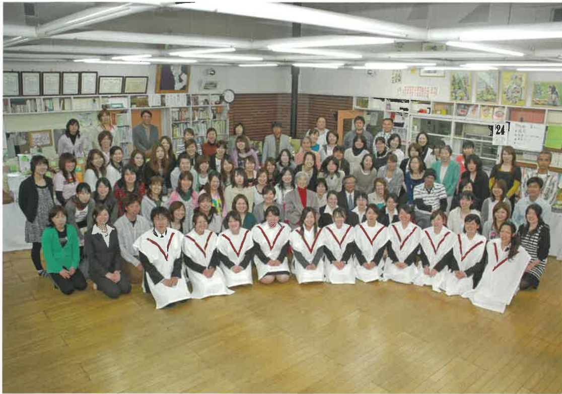
2009年4月24日 新人職員辞令交付式の後職員歓送迎会記念写真